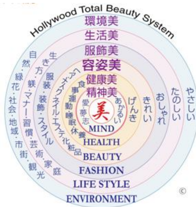
図表 2-1 トータルビューティの概念図

このようなトータルビューティが輝く社会は、もちろんビューティビジネス業界のみの力で実現できるものではないが、ビューティビジネス業界の積極的な取り組みを抜きにしては実現し得ないことも確かである。本学の目的は、まさにこのような理念に基づいて、ビューティビジネスを通して社会に貢献できる人材を養成することにある。こうした環境のなか、ビューティビジネスの「ビューティ」の面では、ヘア・メイク・ネイル・エステ等の技術・技能の習得は、日本では専門学校での、国家試験または業界団体の資格認定試験を目標にした実務教育と就業後のトレーニングによっている。